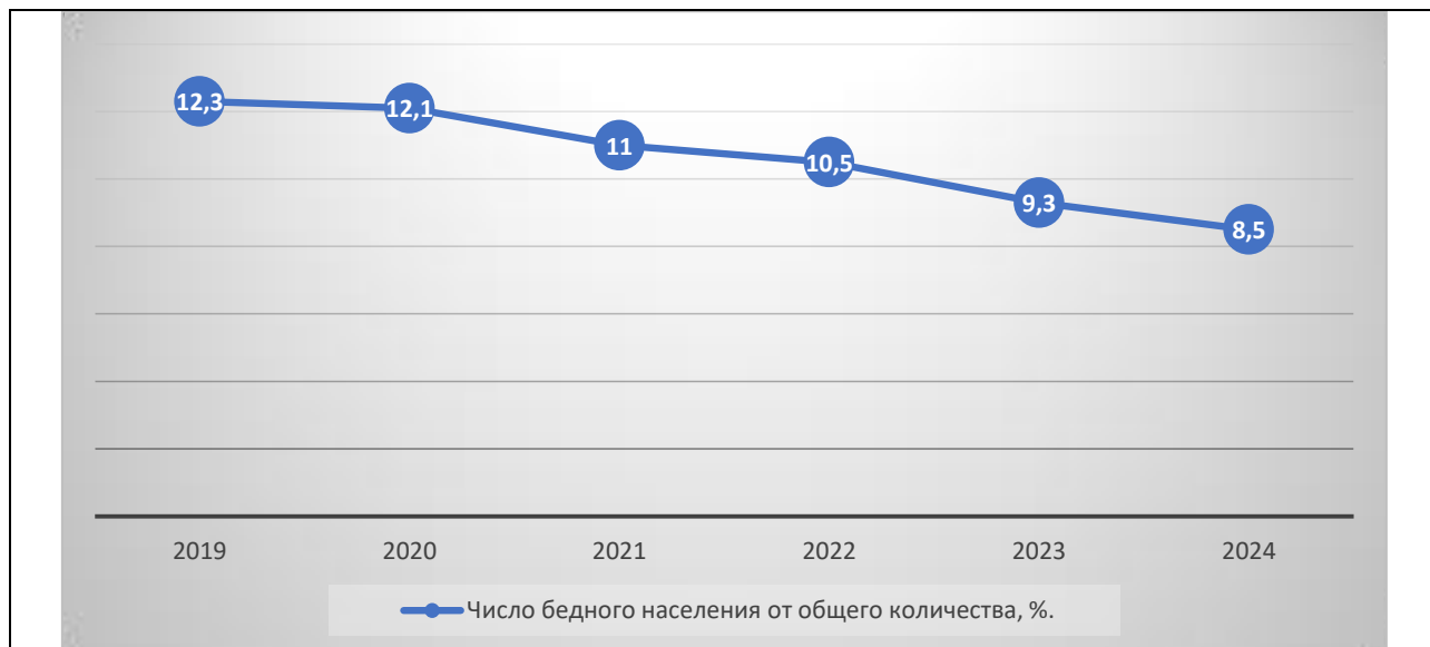
Рисунок 3 – Число бедного населения от общего количества, % [3]

Для обеспечения низкого уровня безработицы и укрепления финансово-экономической безопасности Российской Федерации необходимо развивать комплексные меры. Среди них можно выделить поддержку инновационных отраслей, развитие программ профессиональной переподготовки и повышение квалификации персонала. Государственная политика в области регулирования рынка труда также должна быть направлена на создание новых рабочих мест и обеспечение достойных условий труда.